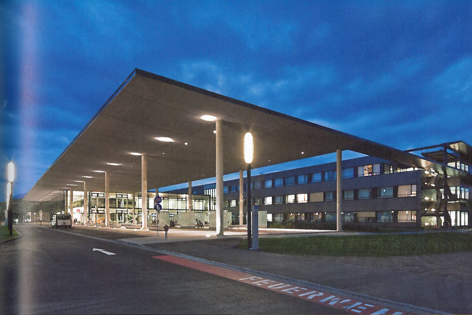
Klinik am Fluss Clinic on the River